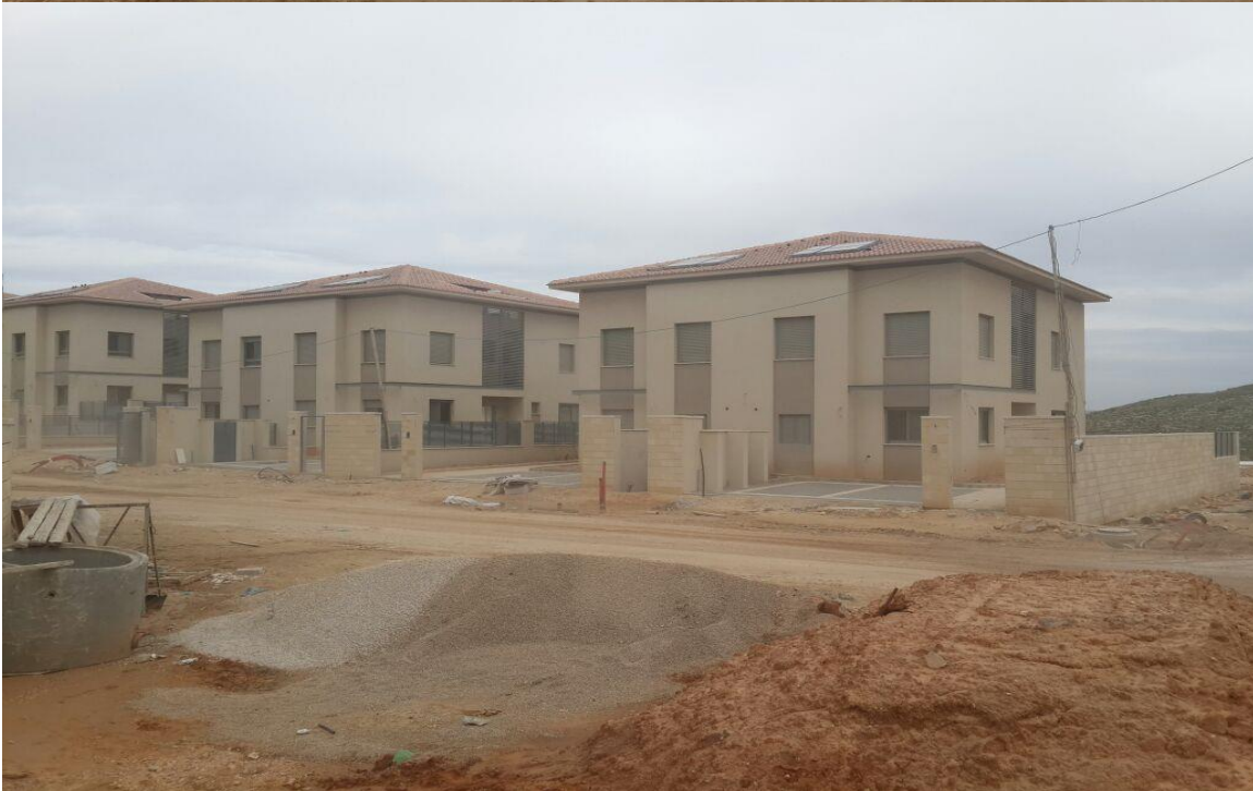
בברכה, איילה א.ג.מ יעוץ נדל"ן בע"מ