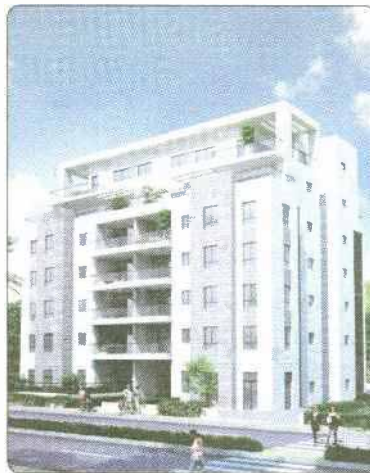
הבניין של "אילה אגם" הדמיה: אי איי הדמיות

כמו כן, למנהלי החברה ניסיון רב בהקמת אלפי יחידות דוור במסגרת פרויקטי הדוור שהקימה מנהלת המגורים בצה"ל עבור משרתי הקבע ואנשי מערכת הביטחון. ב"אילה אגם" מסתכלים קרימה, בהתרגשות, לקראת יציאתם של הפרויקטים הנאים לדרך ולקראת המכרז של" כונת משכנות אומנים ונהנים מהדרך אל רגע השיא, בו הלי" קוח אוהו במפתח לביתו החדש.